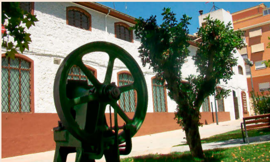
La antigua factoría de Juguetes Payá, hoy Museo del Juguete en Ibi (Alicante).

¿Cuáles son las razones de esta situación? “Lo achacamos a que estudiar Formación Profesional sigue sin estar bien visto. Hay muchos universitarios y mucho personal sin cualificar, pero cuando se trata de mandos intermedios es muy difícil encontrar”, apunta el director de IBIAE. Según afirma, los grados de FP vin-